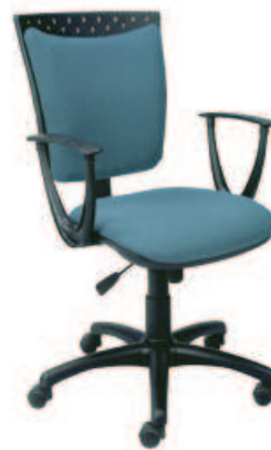
▶ STILLO 09 gtp18 + mechanizm Active-1