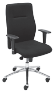
▶ ORLANDO UP R16H steel28 chrome

+ mechanizm Epron Synchron z regulowaną głębokością siedziska