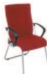
▶ NEO II cfp alu