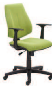
▶ GEM gtp46 ts06 + mechanizm Active-1