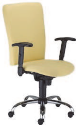
▶ BOLERO II R1B steel02 chrome + mechanizm Epron Synchron