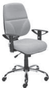
▶ INSPIRE R10 steel02 chrome + mechanizm Active-1