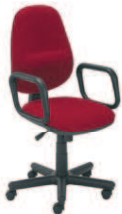
▶ COMFORT profil gtp + mechanizm Active-1