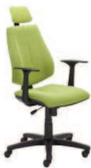
▶ GEM HR gtp46 ts06 + mechanizm Active-1