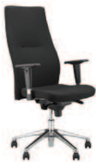
▶ ORLANDO HB R16H steel28 chrome

+ mechanizm Epron Synchron z regulowaną głębokością siedziska