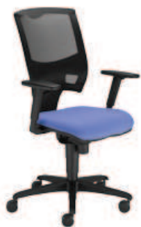
▶ OFFICER NET R19I ts16 + mechanizm Epron Synchron