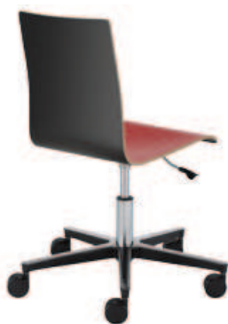
▶ LATTE gts steel23 chrome