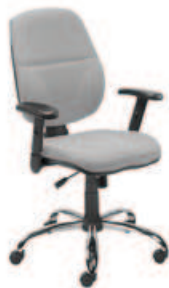
▶ INSPIRE R1C steel02 chrome + mechanizm Active-1