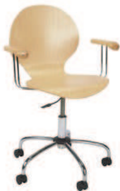
▶ ESPRESSO gtp