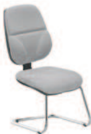
▶ INSPIRE cfs chrome