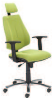
▶ GEM HR R26S steel04 chrome + mechanizm Active-1