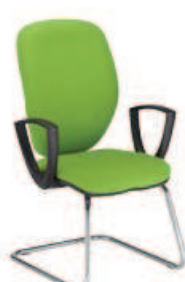
▶ JUMP cfp chrome