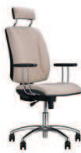
▶ QUATRO HR gtp25i steel04 chrome + mechanizm Active-1