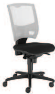
▶ OFFICER NET gts ts16 + mechanizm Epron Synchron