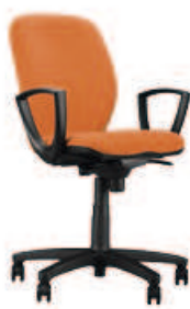
▶ JUMP gtp8 ts06 + mechanizm Epron Synchron