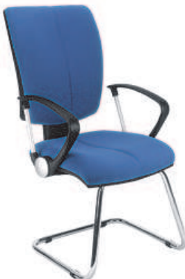
▶ CINQUE cfp chrome