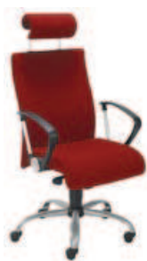
▶ NEO II HR gtp9 steel02 alu + mechanizm Epron Synchron