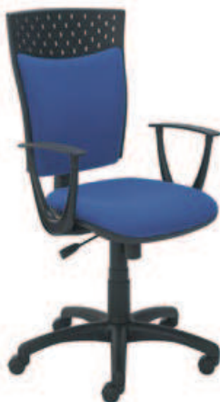
▶ STILLO 10 gtp18 + mechanizm Active-1