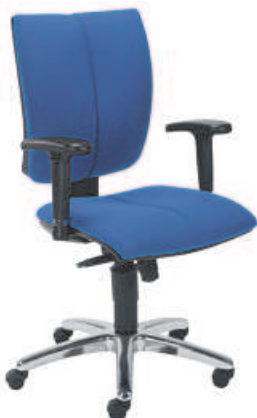
▶ CINQUE R2C steel12 chrome + mechanizm Imarc 840