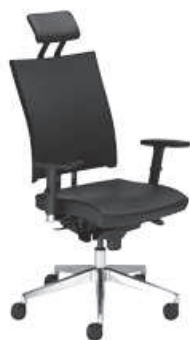
▶ @-MOTION U R15K chrome HRU steel33 chrome

+ mechanizm Epron Synchron z regulowaną głębokością siedziska