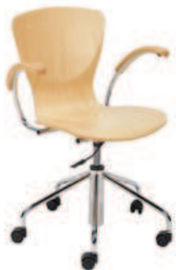
▶ BINGO wood gtp chrome