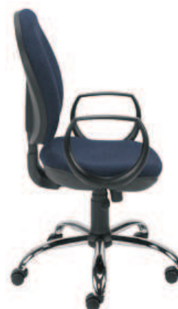
▶ MIND gtp7 steel02 chrome + mechanizm Active-1