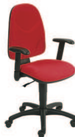
▶ WEBST@R R1E profil + mechanizm CPT