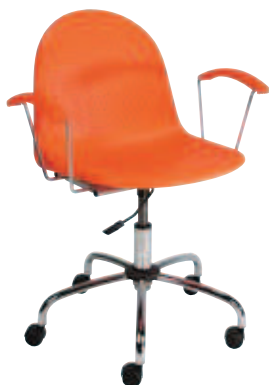
▶ AMIGO gtp chrome