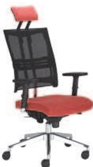
▶ @-MOTION R15K chrome HRU steel33 chrome

+ mechanizm Epron Synchron z regulowaną głębokością siedziska