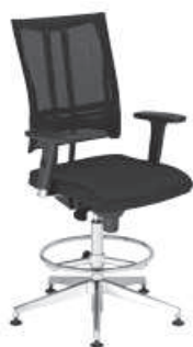
▶ @-MOTION R18K chrome RB steel33 chrome

+ mechanizm Epron Synchron z regulowaną głębokością siedziska