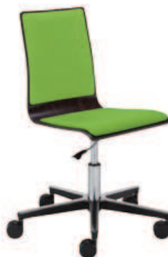
▶ LATTE gts plus steel23 chrome