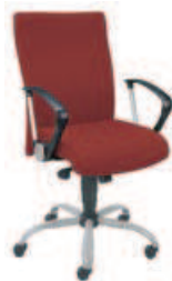
▶ NEO II gtp9 steel02 alu + mechanizm Epron Synchron