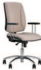
▶ QUATRO gtp25i steel04 chrome + mechanizm Active-1