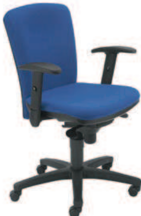
▶ Extreme II R1B ts02 + mechanizm Epron Synchron