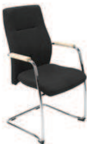
▶ ORLANDO wood steel cfp chrome

+ mechanizm Epron Synchron z regulowaną głębokością siedziska