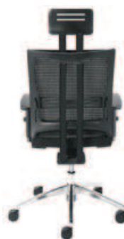
▶ @-MOTION R15K chrome HR steel33 chrome

+ mechanizm Epron Synchron z regulowaną głębokością siedziska