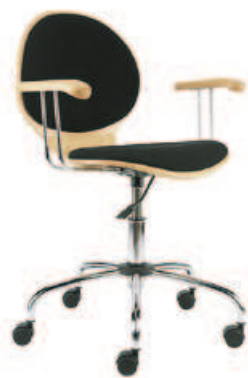
▶ ESPRESSO gtp plus