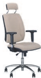
▶ QUATRO HR R2C steel04 chrome + mechanizm Active-1