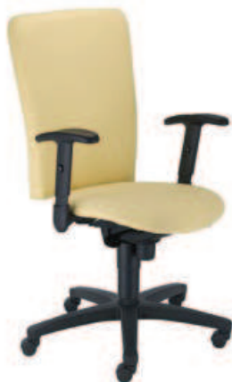
▶ BOLERO II R1B ts06 + mechanizm Epron Synchron