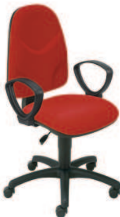
▶ WEBST@R gtp2 profil + mechanizm Kontakt