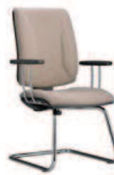
▶ QUATRO cfp 25i chrome