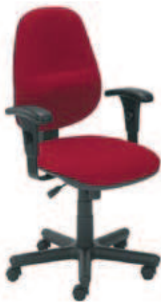
▶ COMFORT profil R ▶ mechanizm Active-1