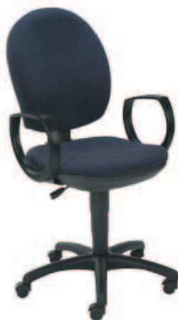
▶ MIND gtp7 ts02 + mechanizm Kontakt