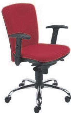
▶ Extreme II R1B steel02 chrome + mechanizm Epron Synchron