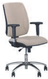
▶ QUATRO R2C steel04 chrome + mechanizm Active-1