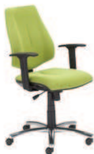
▶ GEM R26S steel04 chrome + mechanizm Active-1