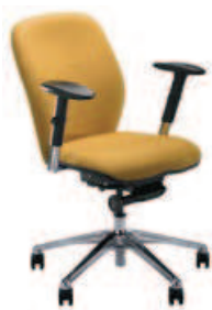
▶ JUMP R15G steel28 chrome + mechanizm Tatto