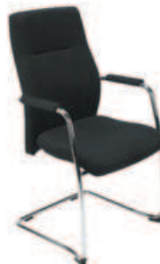
▶ ORLANDO lux steel cfp chrome