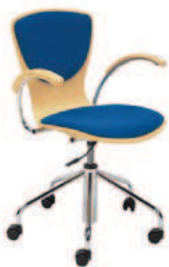
▶ BINGO wood plus gtp chrome